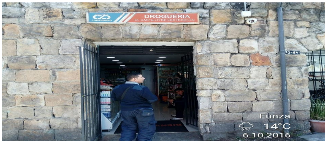
Fotografía No. 1: Panorámica del Aviso del establecimiento ZURCARA S.A.S., ubicado en la Calle 74 No. 2 - 86, elemento tipo aviso en fachada.

Registro fotográfico, Visita No. 1 efectuada el día 06/10/2016